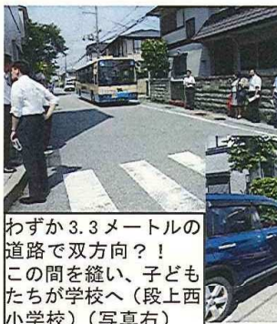
バスが来ると塀にはりつく状態で安全確保(上ヶ原小学校)(写真左)

建設常任委員会はURの建て替え工事が進み、住民の住替えも進んできた浜甲子園団地を視察。今後の余剰地を活用した戸建住宅の建設や緑化計画などの説明を受けました。また、幼稚園や保育所の建て替え問題は未定とのことでした。