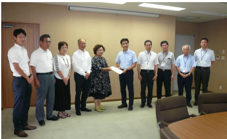
要望書を手渡す議員団（左）と受け取る市長（右）