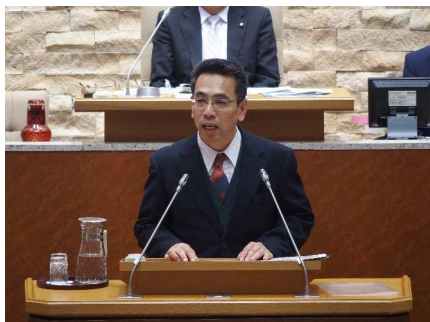
壇上での質問を行う私

整備、中小企業振興条例の制定の三つのテーマで質問を行いました。特にUR借り上げ住宅問題については、党議員団として住民の方たちの命にかかわる問題として12議会連続の質問となりました。