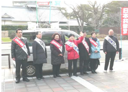
恒例の初出宣伝。左端が私

そうした中で未(ひつじ)年の2015年が幕開け。今年(今年)は4年に一度の一斉地方選挙が行わ