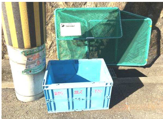
各ごみステーションに置かれるコンテナ

空き瓶・空き缶、ペットボトルなどを入れる、いわゆる燃やさないゴミを入れる青い折りたたみコンテナ。これが昨年の11月から1月にかけて市内各地で行方不明になっています。11月には苦楽園地域に限定されていましたが、最近では市内各地にひろがり、200個近い被害にも。西宮市」と書いてあるのですから他の自治体を持っていくことも考えにくく、海外で売りさばく目的なのでしょう。地域で注意が必要ですね。