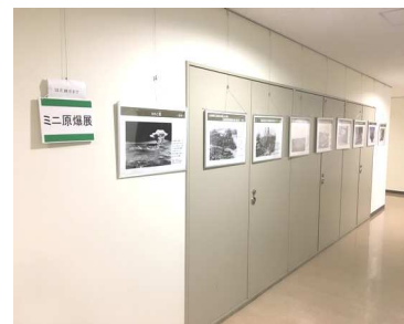
昨年12月山口センター

「Eバクシャ」という言葉が2度使われ重要な位置づけが。被爆者の平均年齢は81歳を超え、今後は被爆の写真や映像を使うなど、被爆の実相の伝承が求められています。