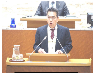
壇上で質問する私

代表質問はなくなりましたが、それぞれの議員が問題意識を持って取り組む一般質問は21人が行ない、私も9か月ぶりに三つのテーマで行ないました。