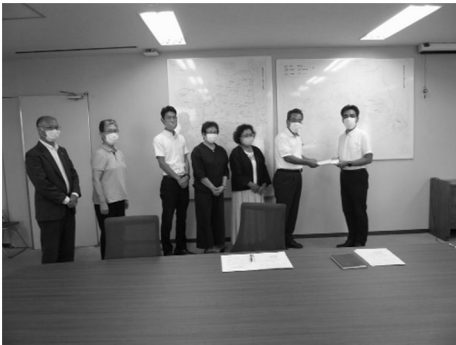
市長に要望書を手渡す私