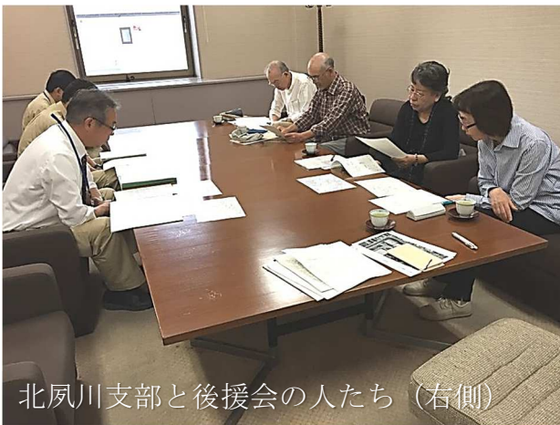
北夙川支部と後援会の人たち (右側)