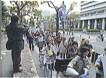
手作りプラカードでパレード

3月10日(土)午後、市役所東館ホ ールに300人もの市民が集まり、西宮から も原発なくすうねりをと、「会」が正式 に結成されました。私もその場に立ち 会い、JR西宮駅までパレードを行いました。 福井の原発再稼働を許さない 運動も急務です。