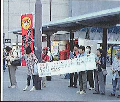
シール投票を呼び掛ける参加者

野田内閣が自民と公明とで強行した消費増税。2014年4月から実施するとしています。