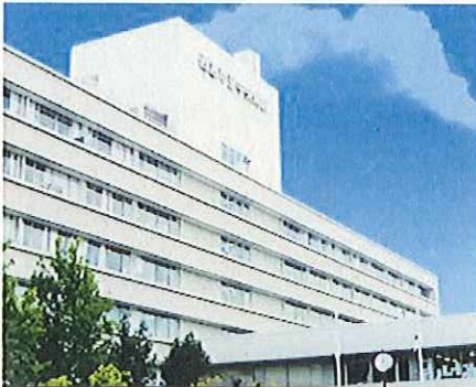
林田町にある西宮市立中央病院

現在、林田町にある西宮市立中央病院は、老朽化が激しく且つ耐震性が不十分なため、建て替えが必要です。一方で、私たちが住む南部地域から遠いため、利便性が悪いことなどから、医業収益が伸びず、慢性的に赤字決算が続いています。