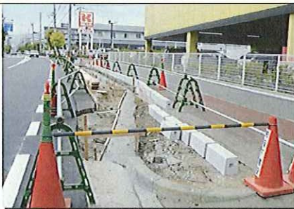
ヤマダ電機前に新設されるバス停留所の工事

マリナ地域から臨港線を、阪神甲子園まで結ぶ新バス路線が夏ごろにも運行予定。マルナカやコーナンなどへも便利になります。