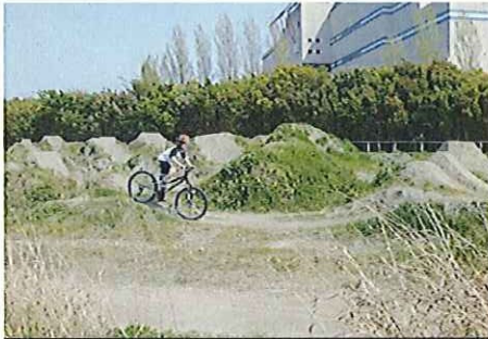
全国大会なども開催される、西宮浜にあるマウンテンバイクの基地

3月議会の私の一般質問で取り上げた、香榎園浜とマリナ地区北西部の公園整備について、南西地域の議員による現地調査を行いました。 25年度市予算は600万円、整備方法などを策定する内容です。 香榎園浜のは自然海浜が残