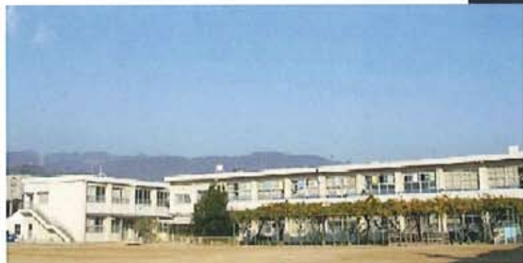
香榎園小学校HPより