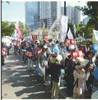
延々と続くパレードの列・列・列・・・

参加者はプラカード等で、買い物でにぎわう三宮の繁華街をラップ調の「コール」でアピールしました。