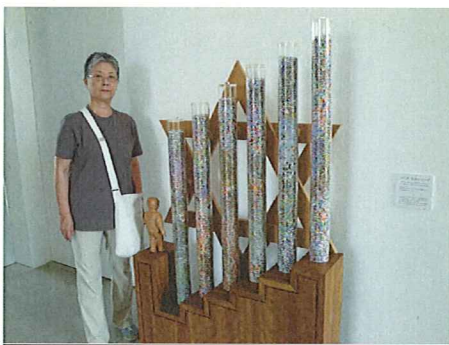
150万個のビーズのモニュメント

は、まず120センチの物差しをあてられ、すんなり通れなかった小さな子供は、そのままガス室へと送られたとのこと。その数は150万人も。ホロコースト記念館の展示物には、150万個のビーズをつめたモニュメントが。二つの施設を見学し、あらためて、「戦争とは、罪もない人々を無差別に殺戮するもの」と実感しました。戦争法案は絶対に阻止しなければ。