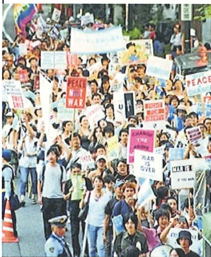
表参道をデモ行進する人々

さらに、全国各地で連日抗議行動やパレードが党派を超えて広がり続けています。参議院での強行採決を許さないために